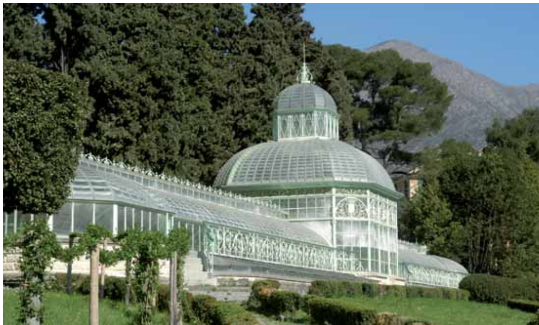
Villa Negrotto Cambiaso