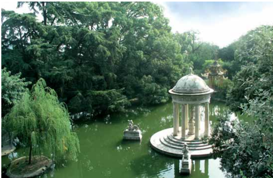
Villa Durazzo Pallavicini