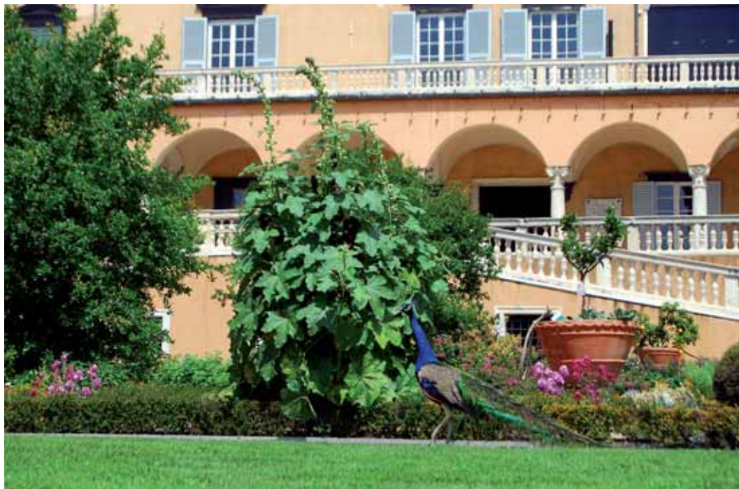
Palazzo del Principe