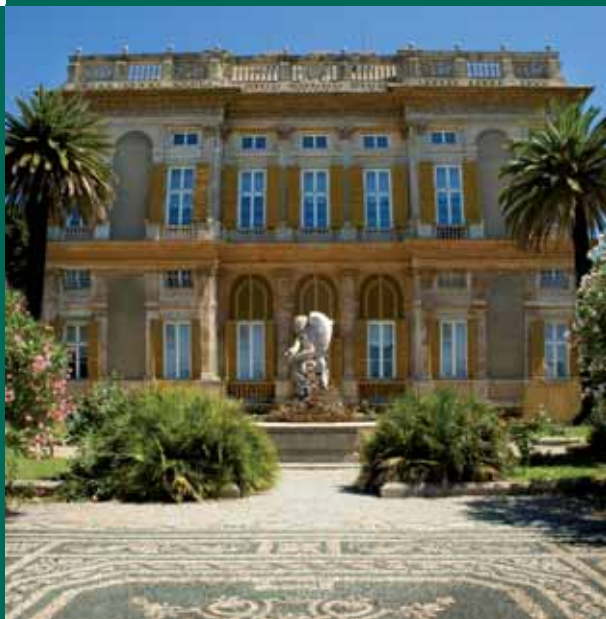
Villa Pallavicino "delle Peschiere" - Genova

Agenzia Regionale per la Promozione Turistica "in Liguria"