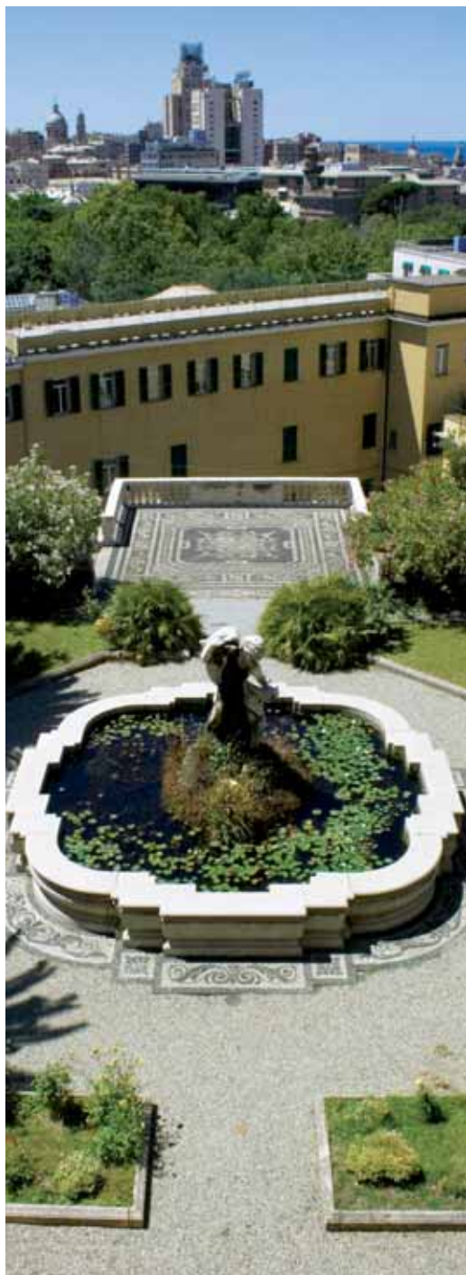
Villa Pallavicino "delle Peschiere"