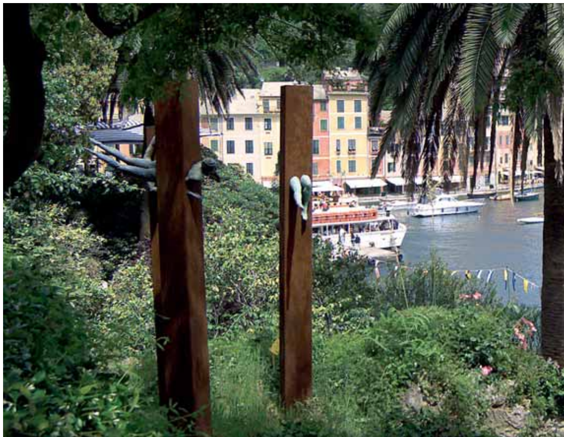
Museo Parco di Portofino