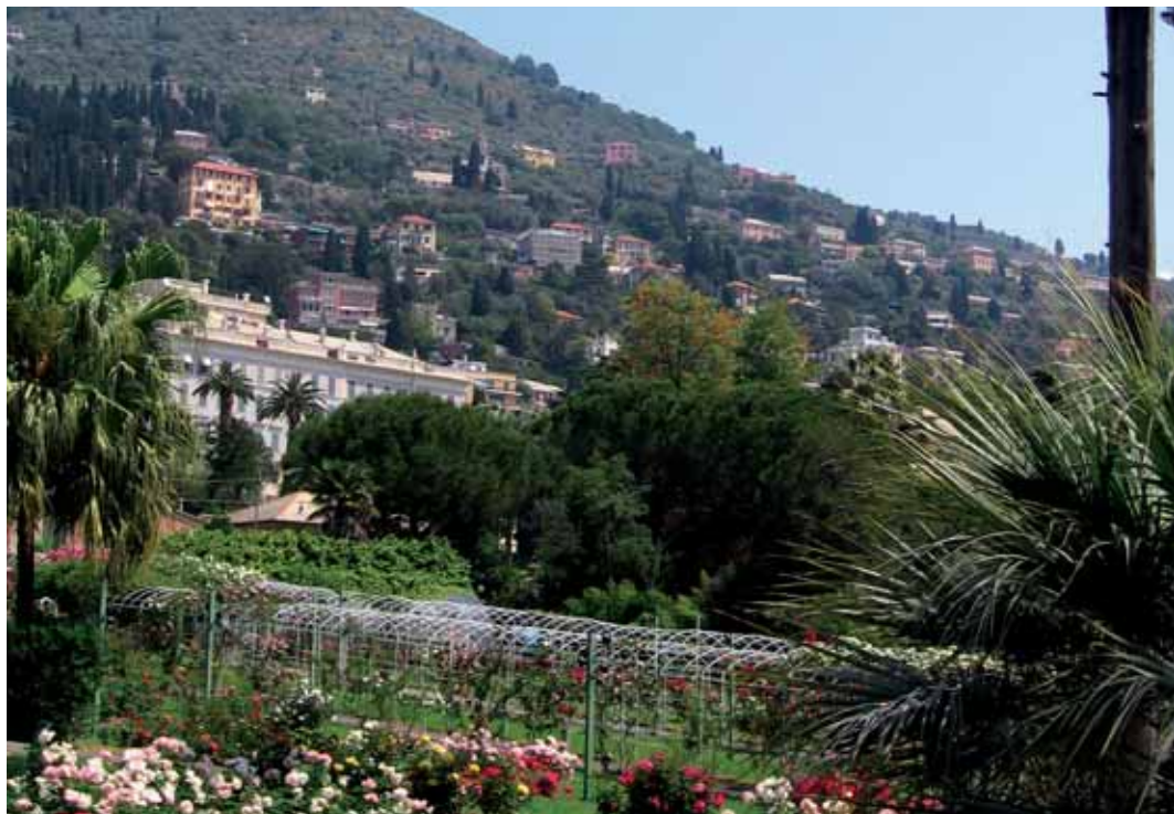
Parchi di Nervi