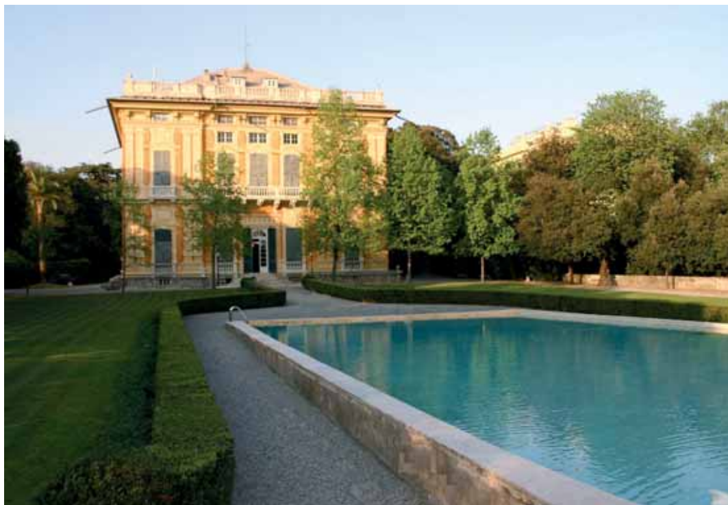
Villa Gropallo allo Zerbino