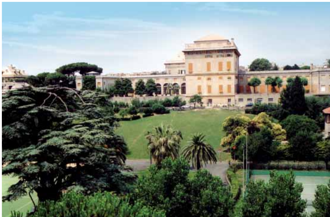
Villa Brignole Sale

Via San Nazaro, 20 - Genova - tel. 010.3620360 - marcelline@libero.it